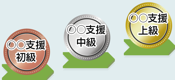
大阪大学URAのスキル区分