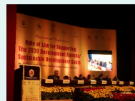
インドにて環境裁判所主催の会議に参加・報告