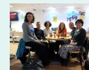
国際プロジェクトのワークショップ後の様子