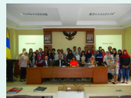
インドネシアにおける現地ヒアリング調査にて