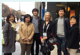
研修出張の様子(INORMS2016(オーストラリア))