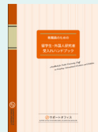
教職員のための 留学生・外国人研究者 受入れハンドブック